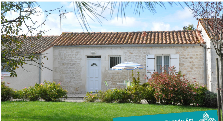
Un écrin de verdure à 15 mn de la mer...

Le gîte « Brouage » se situe au cœur d'une nature préservée avec une vue imprenable sur les remparts de Brouage et le clocher de Marennes. Pour les amoureux de la nature, vous apprécierez l'ambiance particulière du marais au petit matin ou au coucher de soleil.